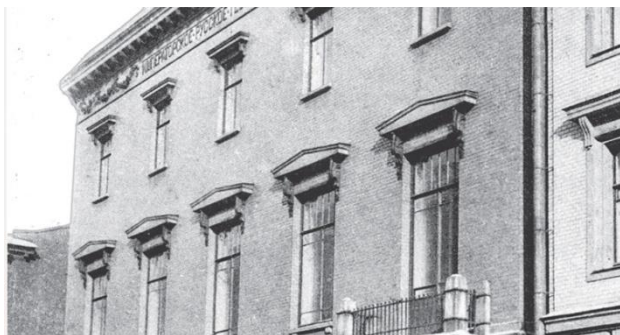
Здание Русского географического общества в Санкт-Петербурге