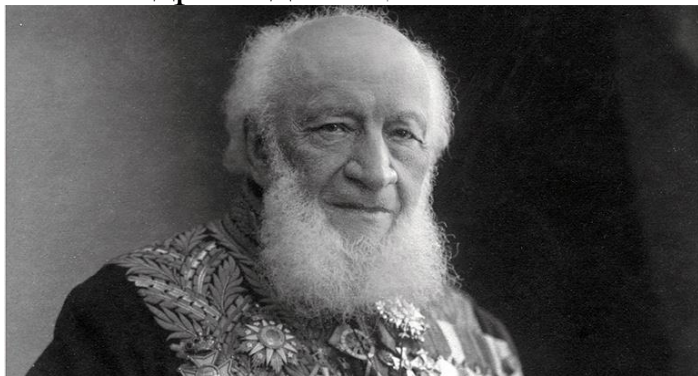
П.П. Семенов-Тянь-Шанский. 1910 г.

14 января исполнилось 195 лет со дня рождения одного из самых ярких уроженцев липецкой земли, знаменитого ученого, путешественника, общественного и государственного деятеля Петра Петровича Семенова-Тянь-Шанского.