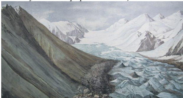
Ледник Семенова в Тянь-Шане